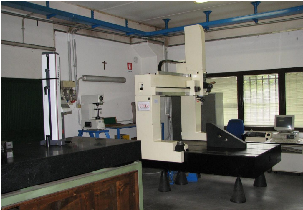
DEA IOTA 1202